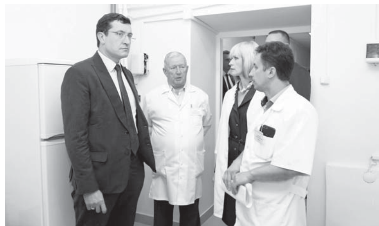
Как выполняется текущий ремонт в детской поликлинике Ветлужской центральной районной больницы глава региона Глеб Никитин проверил лично.

– На данный момент продолжается обсуждение проекта строительства магистрального газопровода Шахунья – Шаранга – Йошкар-Ола. Вместе с тем считаю, что газификация Ветлужского района должна быть проведена вне зависимости от реализации этого проекта. Это позволит создать условия для организации новых производств, малых и средних предприятий. Следствием этого станет появление новых рабочих мест. Мы просчитали все варианты и решили, что Ветлугу в ближайшие годы точно будем газифицировать за свой счет, – подытожил Глеб Никитин.