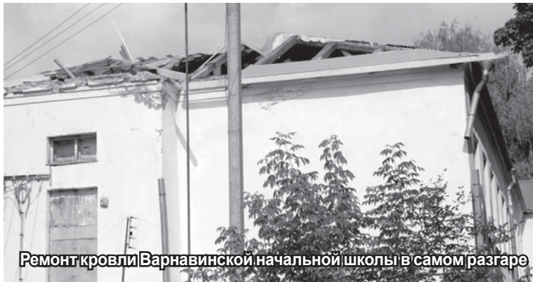
Ремонт кровли Варнавинской начальной школы в самом разгаре