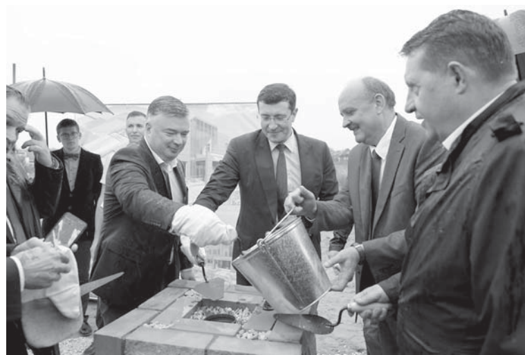
Символическую капсулу времени с добрым посланием потомкам на месте будущего ФОКа вместе с ветлужанами заложил губернатор Нижегородской области Глеб Никитин.

Также серьезное обновление ждет и Роженцовскую среднюю школу – второе по количеству учеников учебное заведение района.