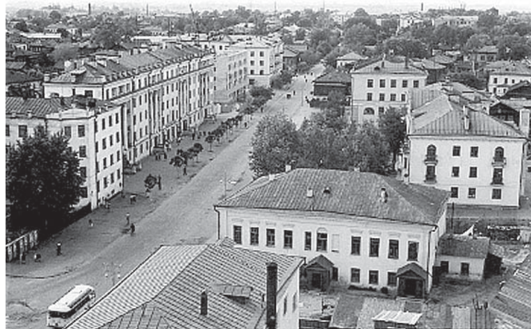
Вид на ул. Текстильщиков с пожарной каланчи г.Кострома.